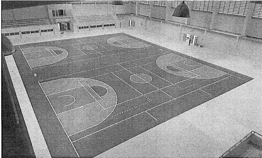
หมายเหตุ : รูปประกอบข้างต้นใช้สำหรับอ้างอิงรูปทรงครุภัณฑ์เท่านั้น